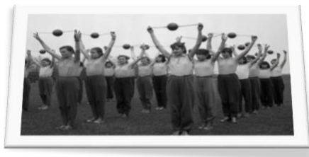
Príprava na spartakiádu

Loptová hra bola podobne vhodnou zábavou počas školskej prestávky a všade tam, kde boli vhodné steny. Nosili sme ju do školy v sieťkach prehodenú cez plece tak, ako školskú kapsu. Škôlka s loptou slúžila zdokonaľiť pohyblivosť, koncentráciu, zručnosť. Stena školy, stena domu pokiaľ možno vzdialená od okna postačila. Podľa určených pravidiel sa lopta hádzala zľahka o stenu: buď pravá ruka, ľavá ruka, obe spolu, skřížené prsty, plesnutie oboma rukami spredu, zozadu, otočenie doprava, doľava pri každom hode, popod pravé, popod ľavé koleno. Podmienkou bolo chytiť loptu a splniť škôlku od jedného do desiateho bodu. Kto bez pádu lopty dokázal splniť škôlku, ten vyhral. Kto nie vypadol z hry a musel opakovať. Ak nebola v dosahu stena, loptová hra sa hádzala o zem a škôlka sa opakovala podobnými šikovnými pohybmi. I v tejto hre platilo