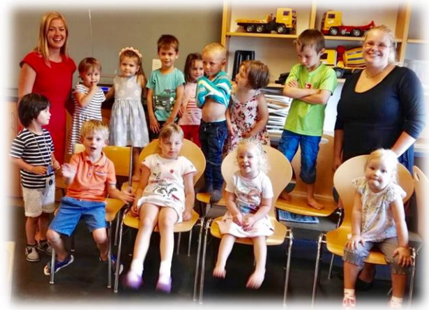
Deti v škôlke vo Wiedikone

Milé deti, milí rodičia, tešíme sa na spoločné stretnutie s Vami v novom školskom roku 2017/2018.