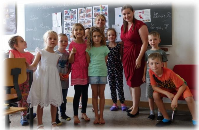
Deti v škole vo Wiedikone

Na dva mesiace sa zatvorili brány Slovenskej škôlky a školy a, dúfame, že si deti i rodičia dobre oddýchli. V nasledujúcom školskom roku sa tešíme na nových i tých stálych škôlkarov a školákov v nových priestoroch v Zürichu – Affoltern a v existujúcich priestoroch Zürichu – Wiedikonu.