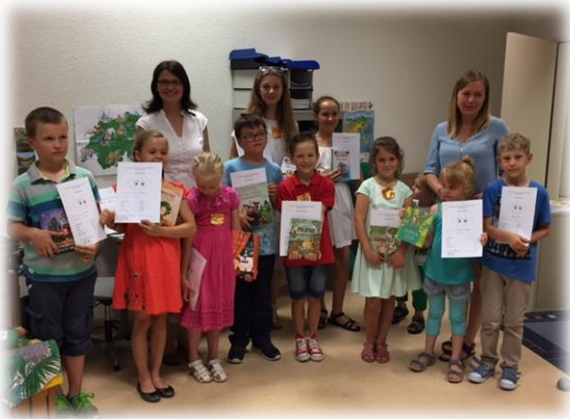
Deti v škole vo Wallisellene