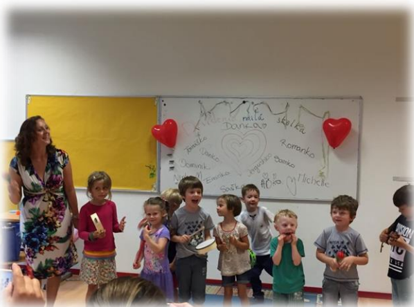
Deti v škôlke vo Wallisellene