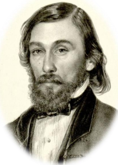
Litografia od Anastasa Jovanovića z revolučného obdobia 1848-49

Zoslabnutý vekom a chorobou zomrel 21. februára 1888 na svojej fare v Hlbokom. Správu o jeho smrti priniesli takmer všetky slovenské periodiká. Skutočnosť, že bol jednou z najvýznamnejších slovenských osobností paradoxne potvrdili ďalšie represie uhorských orgánov. Aj po štyroch rokoch od jeho skonu, počas odhaľovania pomníka na mieste jeho odpočinku, bol zakázaný prístup k Hurbanovmu hrobu nielen verejnosti, ale aj najbližšej rodine. Jeho syn Svetozár Hurban Vajanský v tejto súvislosti uverejnil v Národných novinách článok Hyienizmus v Uhrách , za ktorý dostal vysokú finančnú pokutu a bol odsúdený na ročné väzenie.