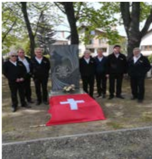
Prof. Aurel. Stodola prichádza späť v pamätiach z Zürichu do svojho rodného domova

hospodárstvo. V kultúrnej časti osláv účinkovala švajčiarska folklórna skupina Alphorngroupe Kaisten z kantónu Aargau hudobným vystúpením na typických švajčiarskych nástrojoch „alphorn“. Doplnenie programu hudobnou skupinou zo Švajčiarska bolo veľmi milé a prekvapivé pre väčšinu prítomných, lebo to videli a počuli prvý krát.